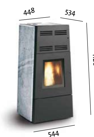
Jøtul PF 1200 parements pierre ollaire

Grande capacité de ventilation (380 m 3 /h), possibilité de distribution d'air chaud