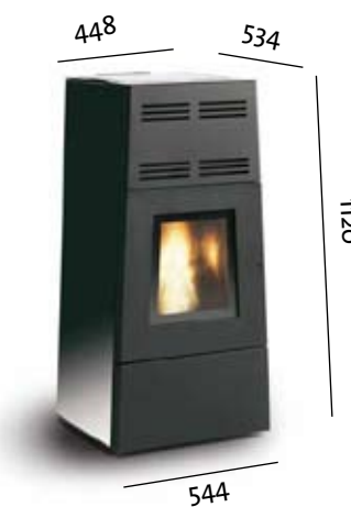
Jøtul PF 800 parements verre teinté noir

Par ailleurs, il fonctionne en convection naturelle sans ventilateur de convection. La garantie d'un chauffage confortable et parfaitement silencieux.