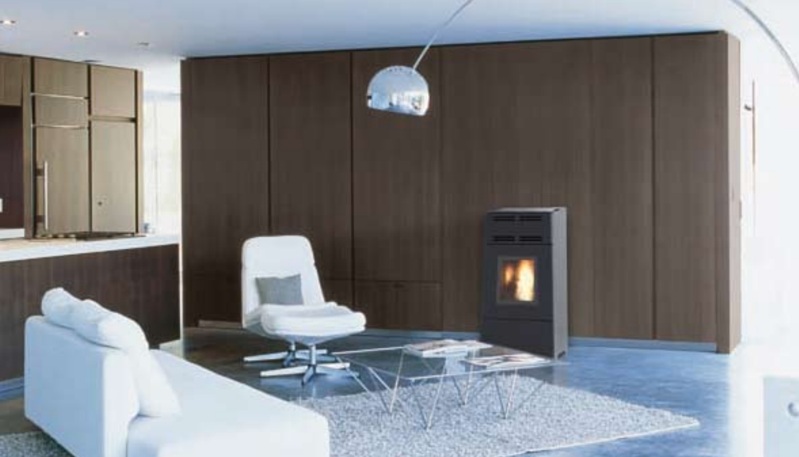
Jøtul PF 600 avec parements acier peint noir