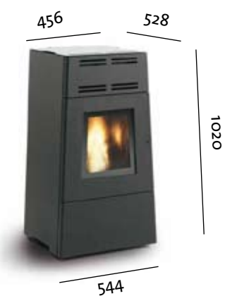
Jøtul PF 600 parements acier peint noir

Selon votre goût, choisissez la version classique en acier, la modernité d'un habillage en verre, ou encore l'authenticité de parements en pierre ollaire.