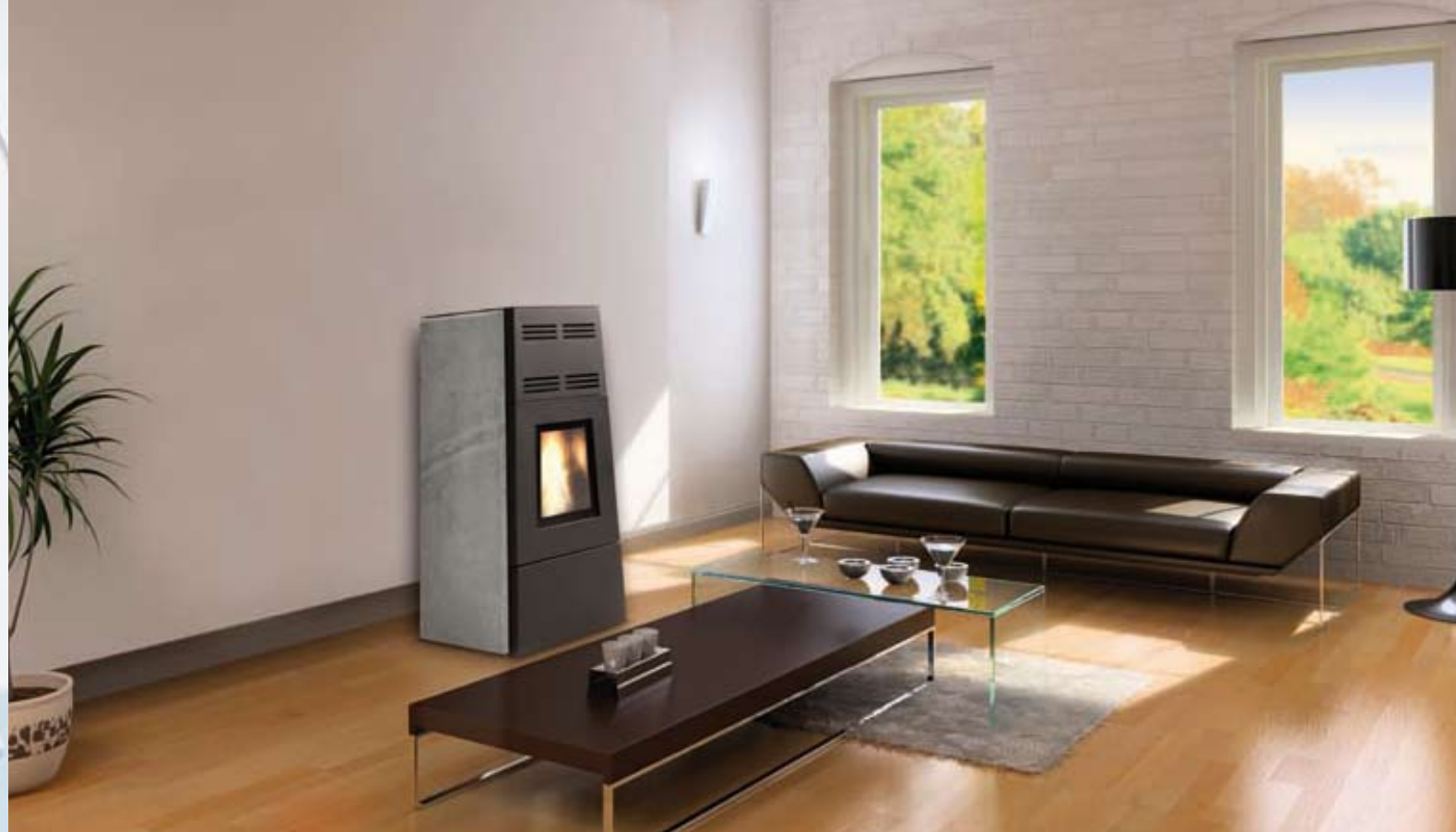
Jøtul PF 800 avec parements pierre ollaire

Modèle silencieux, ventilateur 190 m 3 /h « low noise »