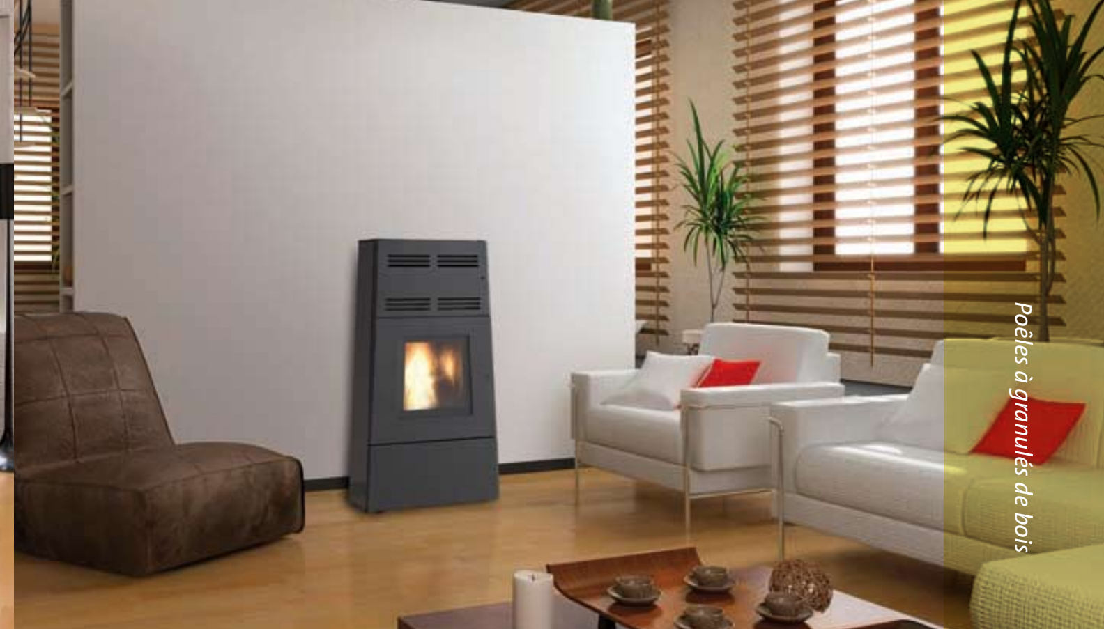
Jøtul PF 1200 avec parements verre teinté noir

Modèle étanche à convection naturelle (étanchéité testée à 50 Pa)